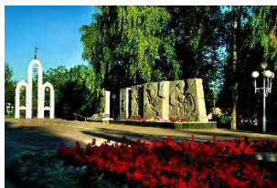
Сквер имени В. Ф. Полякова

- В Ледовом Дворце можно не только кататься на коньках и смотреть хоккей, но и записаться на занятия фигурного катания, записаться в хоккейный клуб, и приятно провести время с друзьями, катаясь вместе на коньках.